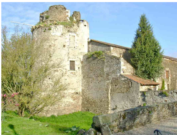
Château de la Galissonnière - la seule tour qui reste aujourd'hui