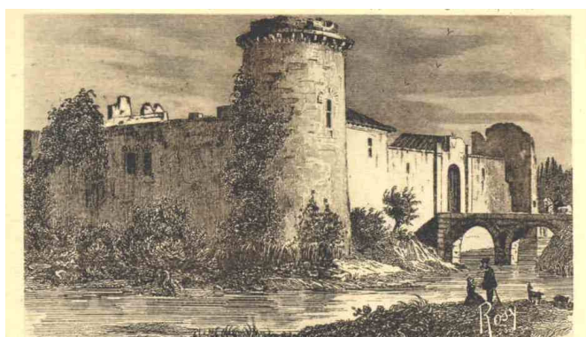
Château de la Galissonnière vers 1820 incendié le 19 septembre 1793 après la bataille de Torfou

d'état-civil, le père Athanase-Scipion appose sa signature et le maire rend au père le document. Quelques mois plus tard, déjà malade, usé par les épreuves, Athanase-Scipion Barrin meurt à Avessac le 19 septembre 1805.