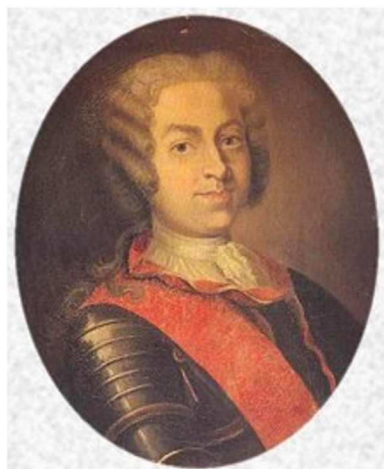
Roland-Michel Barrin de la Galissonnière lieutenant général de la marine - chef d'escadre - ancien gouverneur du Canada

Roland-Michel Barrin fut un grand marin, un habile manoeuvrier à la mer, et un grand savant dans les nombreux domaines où il a pu exercer ses qualités : construction navale, sciences de la navigation, cartographie alors qu'il est pour peu de temps gouverneur du Canada. Se conformant aux instructions données sur les ordres du roi Louis XV, il contribue au développement de la botanique par l'apport en France d'espèces végétales nouvelles. De nombreux livres ont été écrits pour célébrer les mérites de ce grand serviteur du pays et faire connaître les diverses facettes de ses multiples talents dont voici un aperçu.